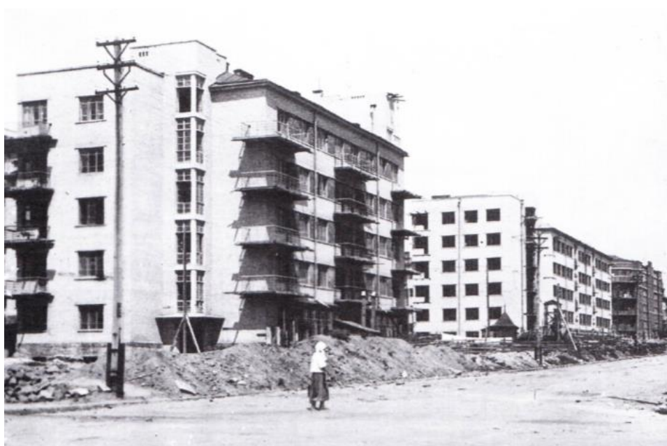
Рис. 2. Комбинаты для жилья.