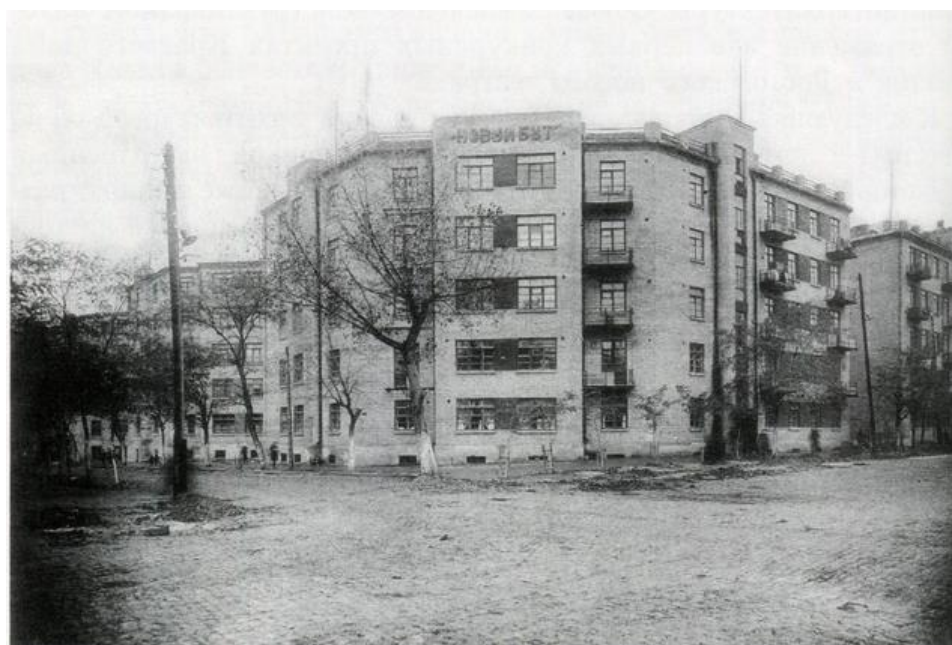
Рис. 3. Дом «Новый быт». Ростов-на-Дону.