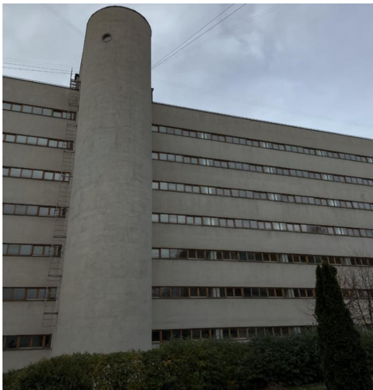
Рис. 1. Дом-Коммуна для студентов, на улице Орджоникидзе.

В основном творческие искания архитекторов и градостроителей тех лет выразились в проектировании и постройке новых типов жилых зданий, таких как жилые комбинаты и дома-коммуны. Кроме того, проектировщики также занимали проблемы организации больших пространств будущих районов, поселков и городов. Примечательно, что в этих вопросах была высока роль